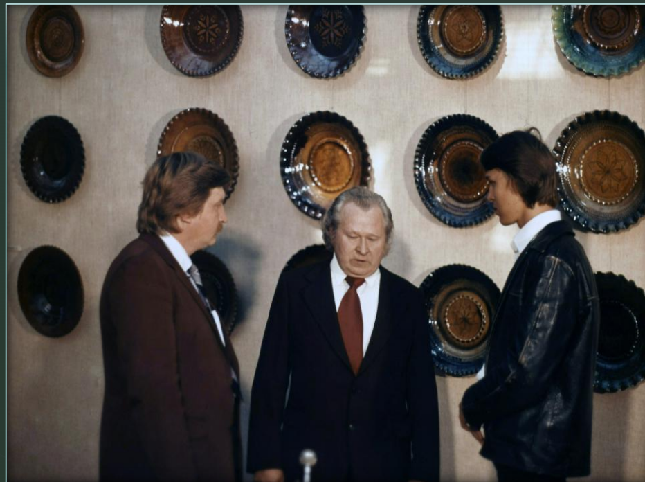
Latgales keramikas izstāde Vissavienības Mākslinieka namā Maskavā, 1982.