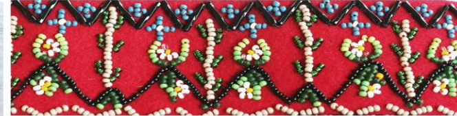
Galvas rota pie tautastērpā ir pati svarīgākā detaļa – mazām meitenēm un jaunām meitām tas ir vainags. Visizplatītākais un raksturīgākais veids latviešu tautas tērpā ir zīļu vainags. Tautasdziesmās raksturoti dažādi zīļu vainagu paveidi.