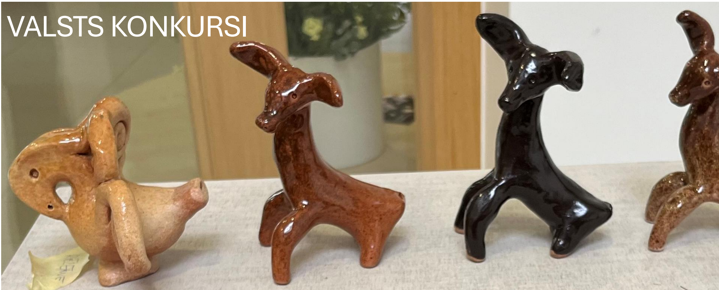
Svilpaunieki: brīnumputns un stirna, Sofija Dudarenoka, Olga Grigorjeva, Mākslu izglītības kompetences centra "Latgales Mūzikas un mākslas vidusskola" Rēzeknes Mākslas un dizaina skola