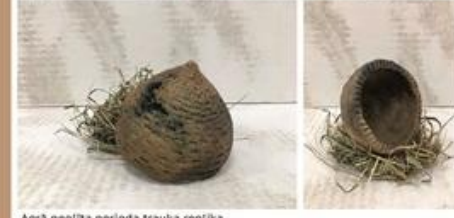
Agri neolīta perioda trauka replika. Pirms un pēc nodedzināšanas.