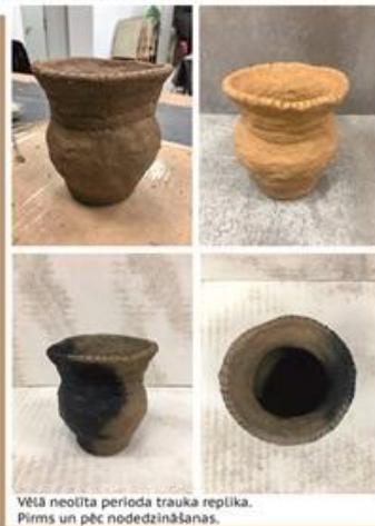
Vēlā neolīta perioda trauka replika. Pirms un pēc nodedzināšanas.