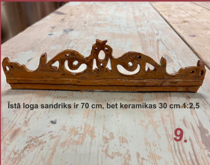
Īstā loga sandriks ir 70 cm, bet keramikas 30 cm 1:2,5