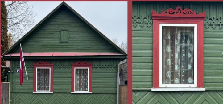
Tika pētīta loga dekoratīvā apdare, koka sandriks, siluetgriezums.