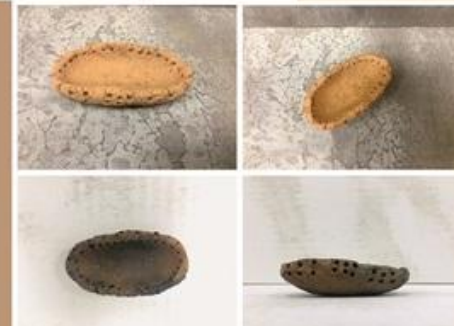
Agri neolīta perioda trauka replika - "laiviotrauks". Pirms un pēc nodedzināšanas.